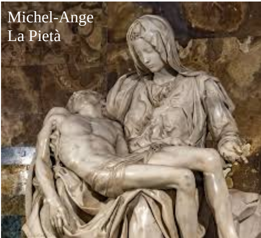
Michel-Ange La Pietà